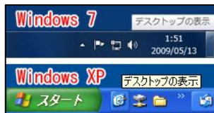
<デスクトップの表示>

また“デスクトップの表示”ボタンの位置がタスクバーの右端へ移動しました。クイック起動上にあつた時に比べ、格段に押し易くなりました。